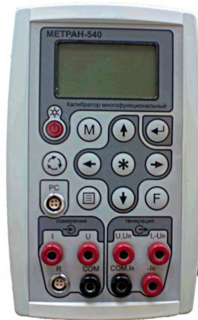
Калибратор многофункциональный Метран-540