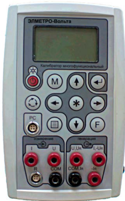
Калибратор многофункциональный ЭЛМЕТРО-Вольта